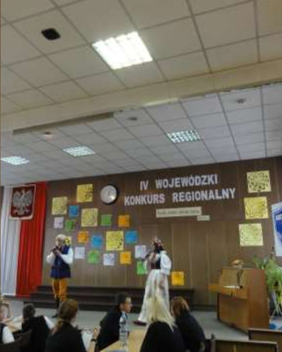
IV WOJEWÓDZKI KONKURS REGIONALNY