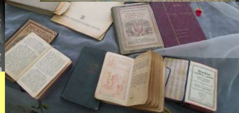
IZBA REGIONALNA W ZSOIZ