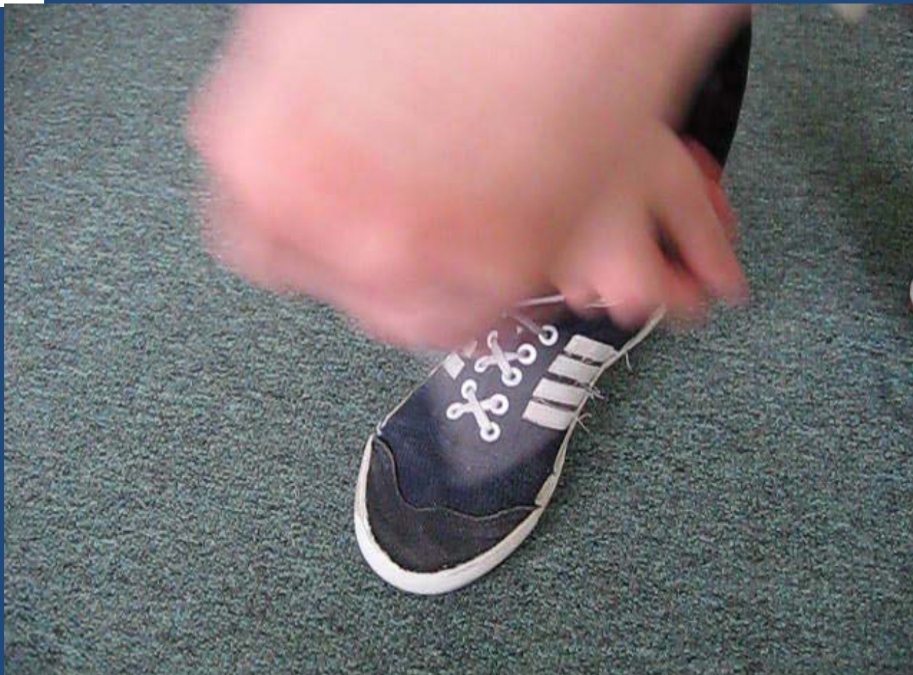
Sznurowanie butów ☺