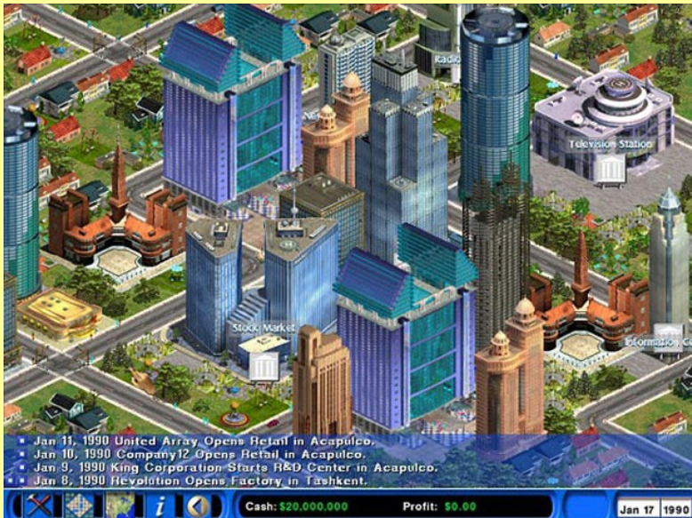
Capitalism II – gra używana w nauce podstaw ekonomii.

Do powyżej przedstawionej klasyfikacji gier będziemy się odwoływać w kolejnym rozdziale, o kategoriach wiekowych, w którym przytoczymy przykłady najpopularniejszych powstałych gier komputerowych i konsolowych – tak historycznych jak i współczesnych.